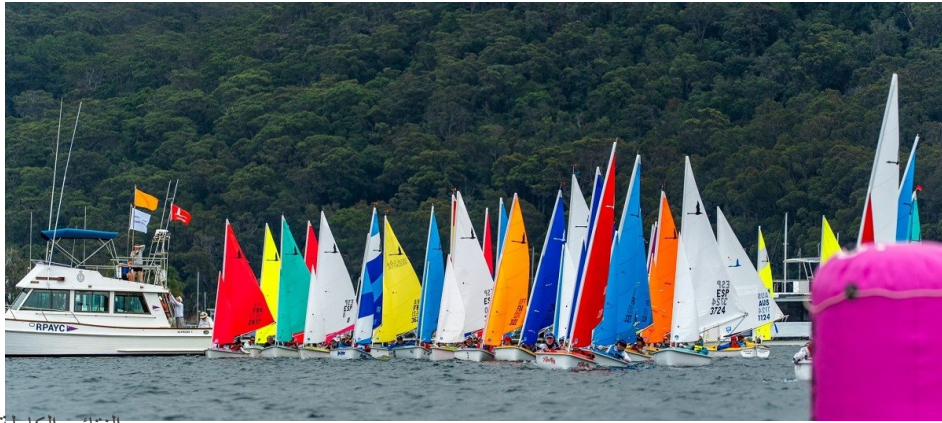
النتائج الكاملة على